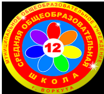
МОУ «СОШ №12»