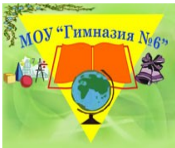
МОУ «Гимназия №6»