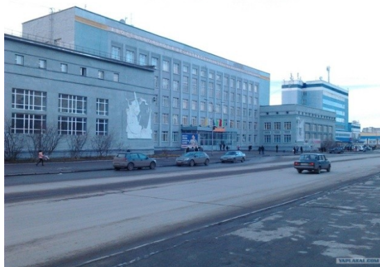
Дворец творчества детей и молодежи