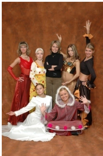
Ритмика и хореография