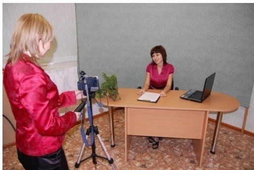
Воркутинское радио и телевидение