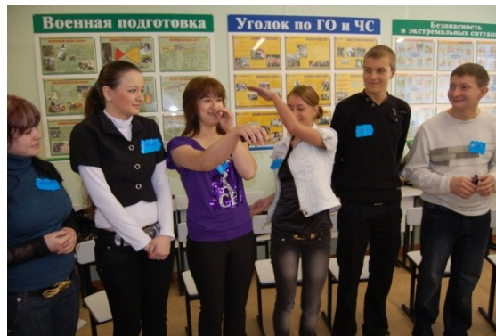
Психологическое сопровождение младших школьников