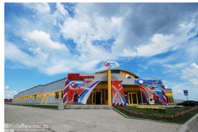
Школа олимпийского резерва