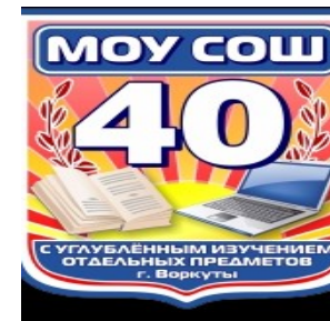
МОУ «СОШ №40»