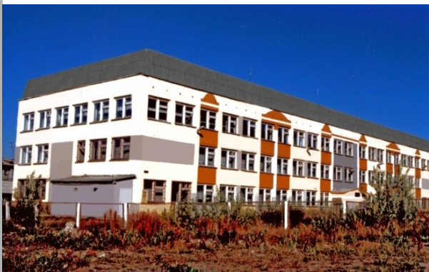
Преподаватели колледжей нашего города