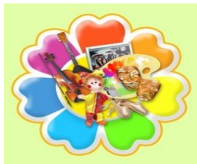
МУ ДО «ДШИ»