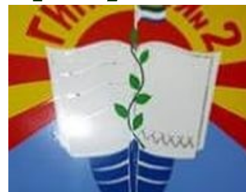
МОУ «Гимназия №2»