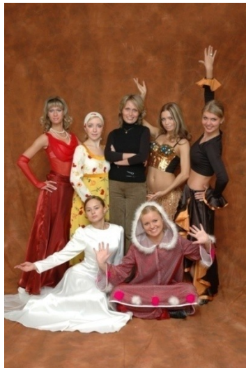
Ритмика и хореография