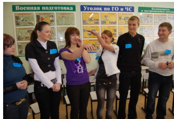
Психологическое сопровождение детей дошкольного возраста