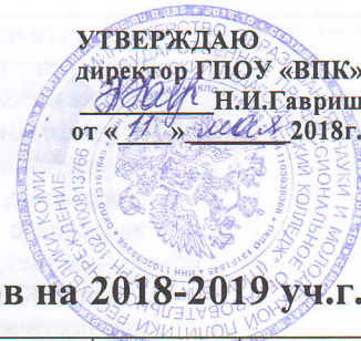
ГРАФИК учебно-исследовательской деятельности студентов на 2018-2019 уч.г.

РАССМОТРЕН на заседании учебно-методического совета протокол № 5 от «11» 05 2018г.